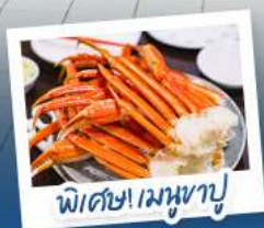
พิเศษ! เมฆหุซุ