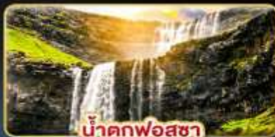
น้ำตกฟอสซา