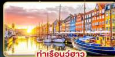
ท่าเรือบูธาว