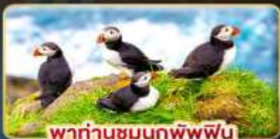
พาท่านชมนกพัฟฟิน