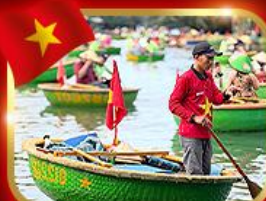
เรือกระด้ง หมู่บ้านกัมทาน