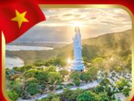
ขอพรกวณอิม วัดหลินอึ้ง