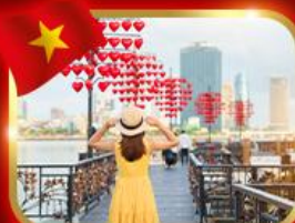
เช็กอินสะพานแห่งความรัก