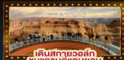
เดินสกายวอล์ก ชมแกรนด์แคนยอน