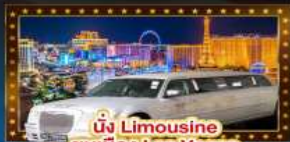
นั่ง Limousine ชมเมือง Las Vegas