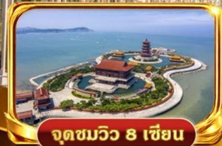
จุดชมวิว 8 เซียน