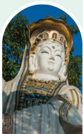
เจ้าแม่กวนอิม ธิพลสัย