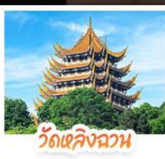
วัดหลิงฉวน