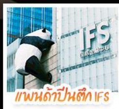
แพนด้าปาร์ค IFS