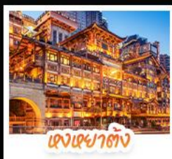
แสงสถาปัตย์