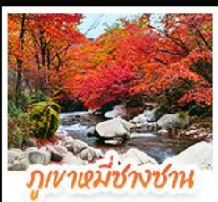
ภูเขาหมื่นชางซาน