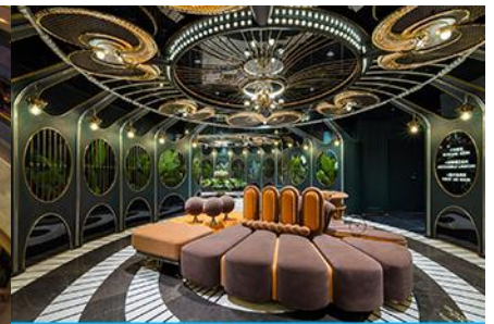
ห้องน้ำไฮเทค