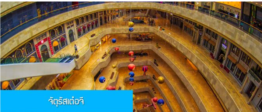
จัตุรัสเต๋อจี