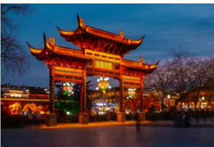
ย่านฟูจื่อเมี่ยว