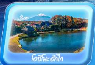
โอชิโนะอ๊กโก