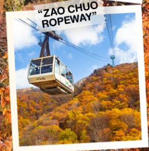
"ZAO CHUO ROPEWAY"

วันเดินทาง 30 ต.ค. - 5 พ.ย. 2569 4 - 10 พ.ย. 2569