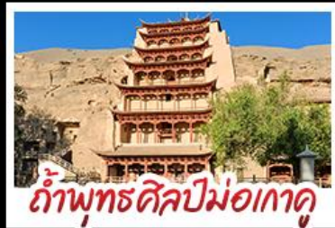
กำแพงพุทธศิลป์ม่อเกาคุ

เป็นทราเวลกรุ๊ป - สระน้ำวังพระจันทร์ ทะเลสาบเกลือฉาซ่า - กำพุทธรศิลป์ม่อเกาคุ หุบเขาสายรุ้งจางเย่ - ทะเลสาบซิงไห่