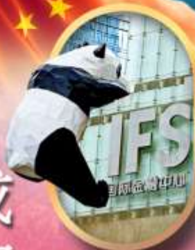
IFS หมีแพนด้าปิ่นด๊ก