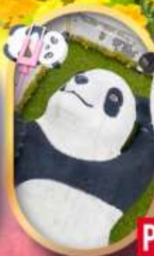
หมีแพนด้าเซลฟี