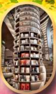
อุทยานปีศาจโกว