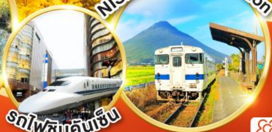
รถไฟชินคันเซ็น

สนุกกับกิจกรรม อบทรายร้อน นั่งเฟอร์รี่สู่เกาะซากุระจิมะ นั่งรถไฟชินคันเซ็นจากเมืองคาโกชิม่าสู่เมืองฟุกุโอกะ