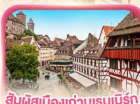
สัมผัสเมืองเก่าบูเรมเบิร์ก