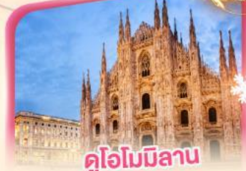
คูโอโมมิลาน