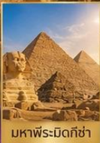
มหาพีระมิดกิซ่า