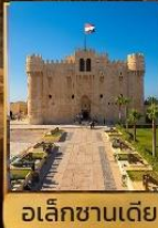
อเล็กซานเดีย