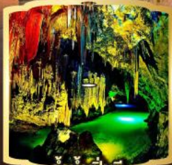
ถ้ำน้ำเป็นซี