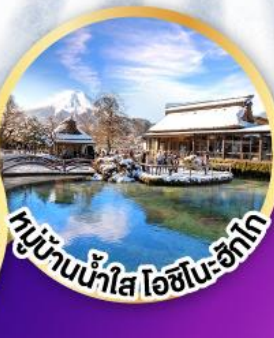
หมู่บ้านน้ำใส ไอชิโนะ-ซึกาโ