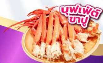
บุฟเฟ่ต์ ซาซิมิ