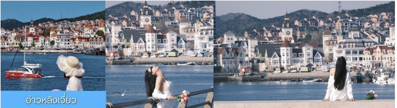
อ่าวหลิงเจี้ยว

จากนั้นนำท่านเที่ยวชม ท่าเรือประมงหู่กาน 大连渔人码头 เป็นจุดเช็คอินที่โดดเด่นด้วยสถาปัตยกรรมสไตล์ยุโรปสีสันสดใส ผสมผสานกลิ่นอายเมืองท่าดั้งเดิมเข้ากับบรรยากาศสุดโรแมนติกที่เต็มไปด้วยเรือประมง คาเฟ่ ร้านอาหาร และจุดชมวิวยุริมาทะเล