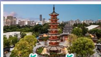
วัดเลงฮั่ว