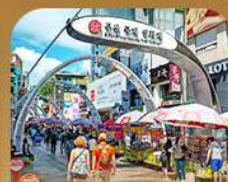
ตลาดนัมโพดง