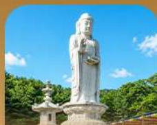
วัดดงซาซา