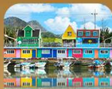
ท่าเรือจังกึม