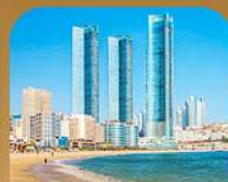
หาดแซอินแด