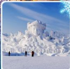
งานแกะสลัก เกาะพระอาทิตย์