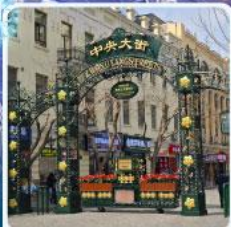
ถนนจงยาง