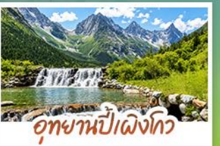
อุทยานปี่ผิงโกว