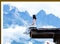
ร้านอาหารแพ่เขยูนตันอัน

ชมวิวภูเขาหิมะสวยสุดโรแมนติกกับแสงยามพลบค่ำ เที่ยวเมืองโบราณต้าหลี่ ลี้เจียง ป๋อซา แขงกรี่ล่า ชมวิถีชีวิตของชุมชนยูนนานและทิเบต พิสูจน์ความกล้าท้าเดินชมสะพานแก้วลี้เจียง • ช้อปปิ้งเพลินที่ถนนคนเดินหนานผิงเจียง