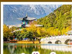
สระมั่งกรถ้า