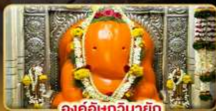
องค์อชฏวินายัก