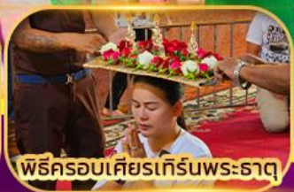
พิธีครอบเศียรเทรินพระธาตุ