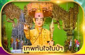
เทพทันใจในป่า