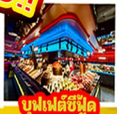
บูฟเฟ่ต์ซีฟู้ด