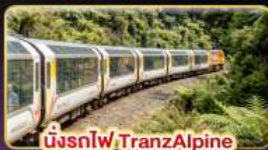
นั่งรถไฟ TransAlpine