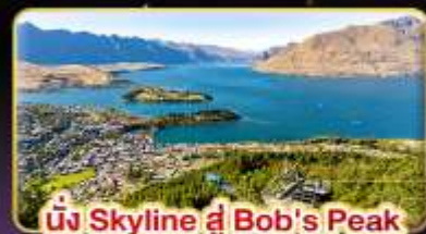
นั่ง Skyline ที่ Bob's Peak