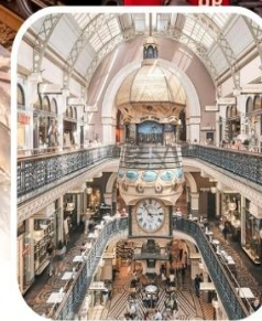
QUEEN VICTORIA BUILDING