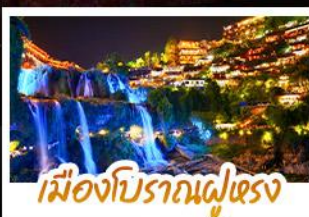
เมืองโบราณผู่แรง