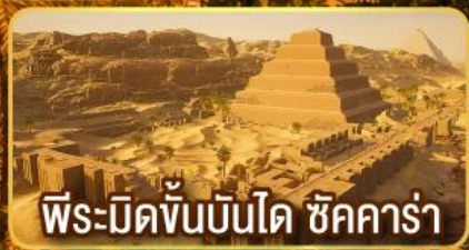
พีระมิดขั้นบันได ชิคคาร์่า