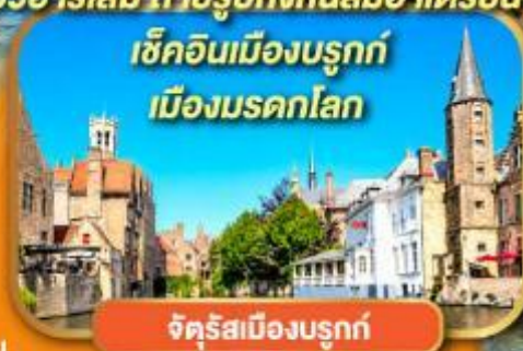
จัตุรัสเมืองบรูคก์