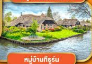
หมู่บ้านก็ธูร์น