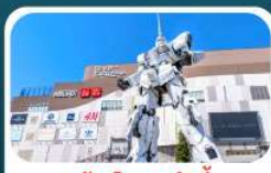
ห้างไดเวอร์ซิตี