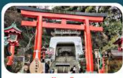
ศาลเจ้าอินะชิมะ