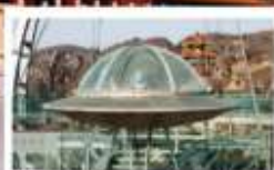
UFO Glass Platform