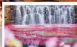
น้ำตกทะเลสาบน้ำ 7 สี

🧳 โหลด 23 KG. x1 ทั้งไป - กลับ ✓ ฟรีนียบตัว ✓ ไม่เข้าร้านรัฐบาล ✓ ทีวีรูปเล็ก ✓ รวมค่าเข้าสถานที่ตามโปรแกรม