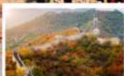
ท่าแพงเมืองจีน ด่านป่าต้าหลิ่ง