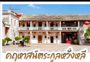
คฤหาสน์ตระกูลหวังเสี

คาบรอยภาพยนตร์สุดซึ้งแห่งปี "จดหมายรักถึงอาม่า" • เยือนเมืองโบราณแต่จิ๋ว ดื่มด่นดื่มกำเนิดชาวจีนโพ้นทะเลที่อพยพสู่ประเทศไทย • เดินเล่นหมู่บ้านโบราณหลงหู สัมผัสบรรยากาศแต่จิ๋วดั้งเดิมราวกับหลุดเข้าไปในอีกหนึ่ง • ชมย่านเมืองเก่าชิวเถาและ สวนสาธารณะสีเขียวขงหยวน หนึ่งในสถานที่ถ่ายทำที่ได้รับความนิยมจากแฟนภาพยนตร์ ชมจดหมายโบราณอายุกว่าร้อยปี ณ พิพิธภัณฑ์จดหมายชาวจีนโพ้นทะเล