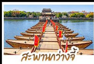
สะพานหว่างจี