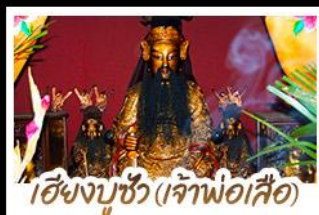
ไฉงบูชู่ (เจ้าพ่อเสือ)