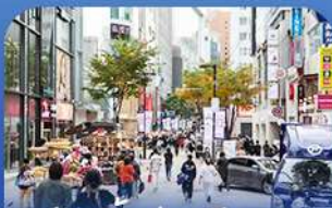
ช้อปบิงช่าแม็ยงดง