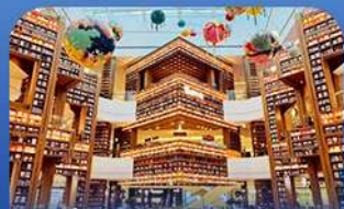
ต๋องสมุดสตาร์ฟิค