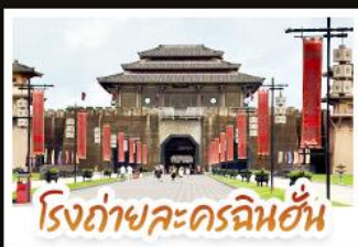
โรงถ่ายละครฉินฮั่น

ชมวิวนุ้บ้านม้งซีเจียงพันหลังคา • อุทยานเสี้ยวซิ่ง มนต์เสน่ห์จิวจิวไถน้อย • อิสระช้อปปิ้งกับถนนคนเดิน สามตรอกสองซอย • สูดอากาศให้เต็มปอดบนยอดเขาชิงซิ่ง พร้อมชมความสวยงามของมวลดอกไม้ตามฤดูกาล