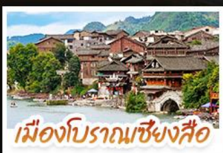
เมืองโบราณเซียงสือ