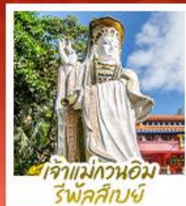
เจ้าแม่กวนอิม ร่ำฟ้าส่าย