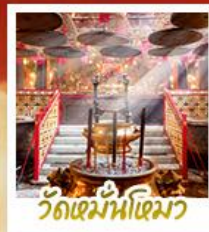
วัดเมฆันไทมว