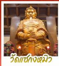
วัดเซกุงเมิว