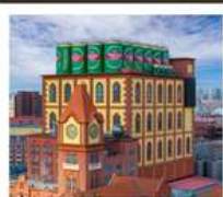
โรงงานเบียร์สิงเต่า