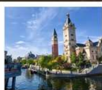
เมืองเวนิสแห่งต้าเหลียน