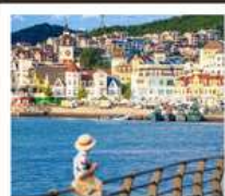
อ่าวหลงเจียง