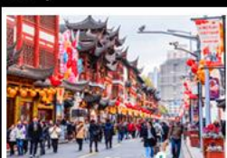
เฉิงหวิงเมี่ยว