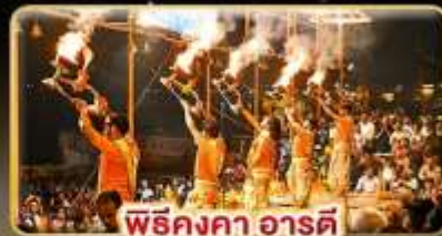
พิธีคงคา อารดี