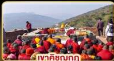
เจาศิขณกฤ