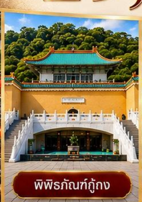
พิพิธภัณฑสถานแห่งชาติ