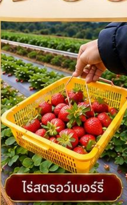
ไร่สตอร์เบอร์รี่