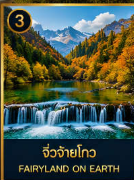
3 จิวจ้ายโกว FAIRYLAND ON EARTH