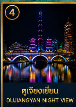
4 ตูเจียงเยียน DUJIANGYAN NIGHT VIEW