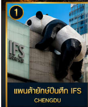
1 แพนด้ายักษ์ป็นตึก IFS CHENGDU