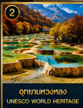
2 อุทยานหวงหลง UNESCO WORLD HERITAGE