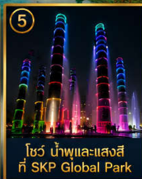
5 โชว์ น้ำพุและแสงสี ที่ SKP Global Park