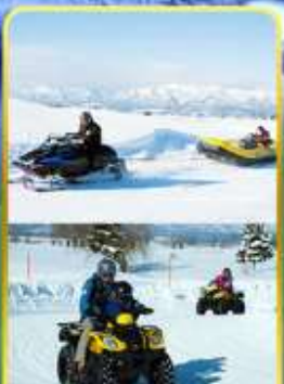
BIBAI SNOW LAND