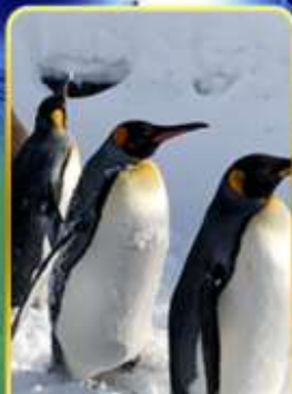
พาครอบครัวชมทิวทัศน์