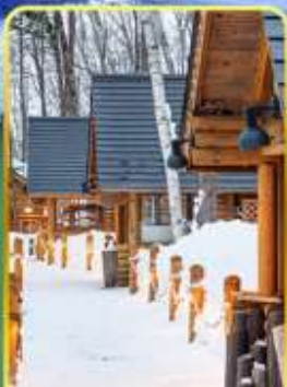
มีงกั๊กเกอร์