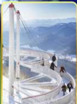
ระเบียงหมอกน้ำแข็ง