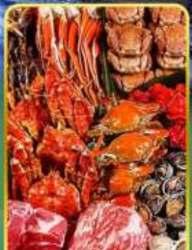
ปิ้งย่างพรีเมียมมันตะ