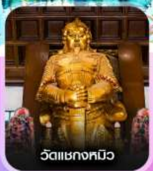
วัดเชกขงหมิว