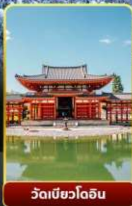
วัดเมียวโด้อิน