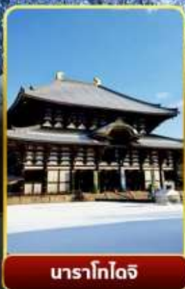
นาราโกโตจิ

พิเศษพักในเมืองคุสัทสึออนเซ็นพร้อมชมยูบาคาเกะ