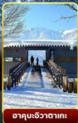
ฮาคุบะอิวาตาคะ