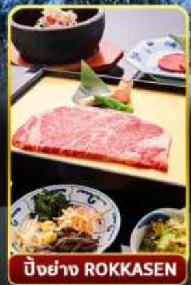
บิ๊งย่าง ROKKASEN

ออนเซ็น 3 คั้น มน.กระเป๋า 1 ใบ 23 กก 9Days 6Night