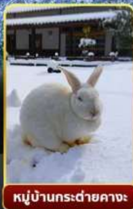
หมู่บ้านกระต่ายคางะ