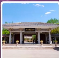
อุทยานประวัติศาสตร์จิวจวน