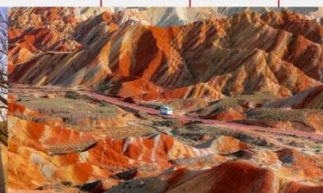
ภูเขาสายรุ้งจางเย่ต้นเสี่ย