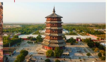
วัดเจดีย์ไม้ มู่ต้า

*ทางบริษัทฯ ขอสงวนสิทธิ์ในการสลับโปรแกรมทัวร์ตามความเหมาะสมขึ้นอยู่กับสถานการณ์หน้างาน โดยคำนึงถึงผลประโยชน์ของลูกค้าเป็นสำคัญ