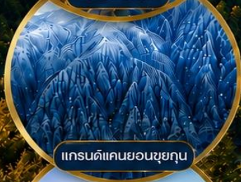
แกรนด์แคนยอนซุยกุณ