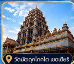
วัดมัตตุกโกโต เซดเตียร์