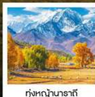
ทุ่งหญ้านาราที

ทัวร์คุณธรรม ไม่ลงร้านช้อปปิ้ง ไม่ขายออฟชั่น