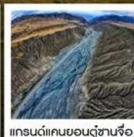
แกรนด์แคนยอนตู้ซานจือ