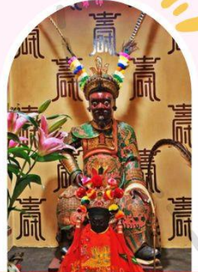
วัดเซ่งจ้งเก้งเก่าแก่ 400 ปี ไซกง