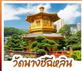
วัดนางชีฉีเสก