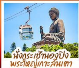
นั่งกระเช้าแองปิง พระใหญ่เกาะคัมตา