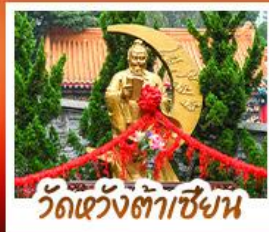
วัดเจ้าจู้ตาเซ็ง

ขอพรเซงครบทั้ง 3 องค์ เรื่องโชคลาภ การเงินและธุรกิจ • นั่งกระเช้าแองปิง สักการะพระใหญ่เทียนถาน • เจ้าแม่กวนอิมฮ่องง้อา ขอเรื่องเงิน ทรัพย์สิน ความมั่งคั่งเจ้าแม่กวนอิมริมทะเล ขอพรเรื่องความสำเร็จ ไขคดีเปิดเป้าสิ่งไม่ดี พื้ทโรงเมง 4 ดาว แหล่งช้อปปิ้ง...ย่านจิบชาจู้หรืออ่าเมงกิก